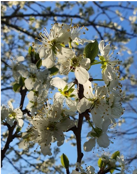
kersenbloesem in volle bloei